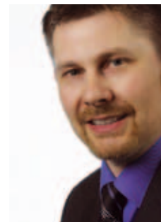
DER AUTOR Eckhard Kummrow ist Mitarbeiter der Hessischen Fachstelle für Öffentliche Bibliotheken bei der Hessischen Landesbibliothek Wiesbaden.